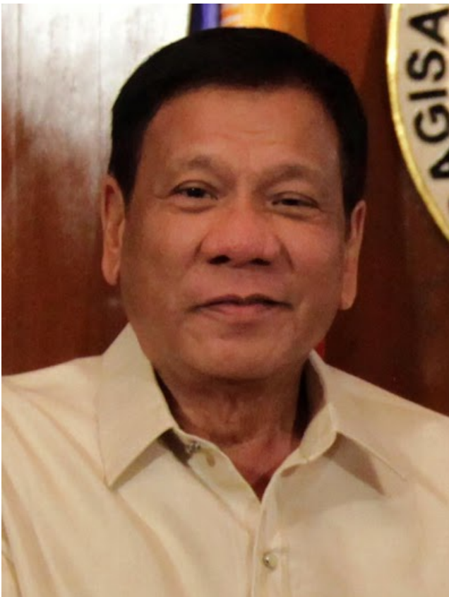
Rodrigo Duterte [2016, gemeinfrei]

Die Republik der Philippinen sind weitgehend ein dem US-amerikanischen Vorbild folgendes Präsidentsystem mit zwei Kammern, dem Repräsentantenhaus » mit etwa 290 Abgeordneten (darunter eine bestimmte Zahl reservierter Sitze im Rahmen des Party-List-Systems ») und einem 24-köpfigen Senat ». Die Kongressabgeordneten werden alle drei Jahre gewählt, während die Amtszeit von Senatoren sechs Jahre beträgt, wobei jeweils die Hälfte von ihnen nach drei Jahren gewählt wird.